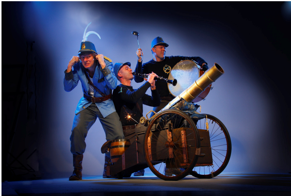
Uit de voorstelling De Meesterzet