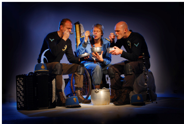
Uit de voorstelling De Meesterzet

De voorstellingen van Rood Verlangen hebben als doel het gevoel voor taal, verbeelding en cultuur bij kinderen te stimuleren. Via de vertelkunst, muziek en theaterspel maken zij kennis met de rijkdom van de taal. Deze voorstelling is geïnspireerd op het thema poëzie van de Kinderboekenweek 2008.