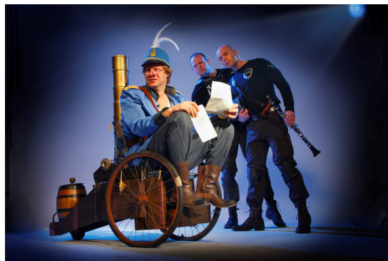
Uit de voorstelling De Meesterzet